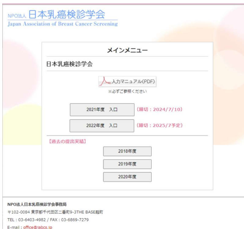
図 3.1 過年度入力あり

●【過去の提出実績】の「20xx年度」をクリックすると過年度の実績を確認することができます。