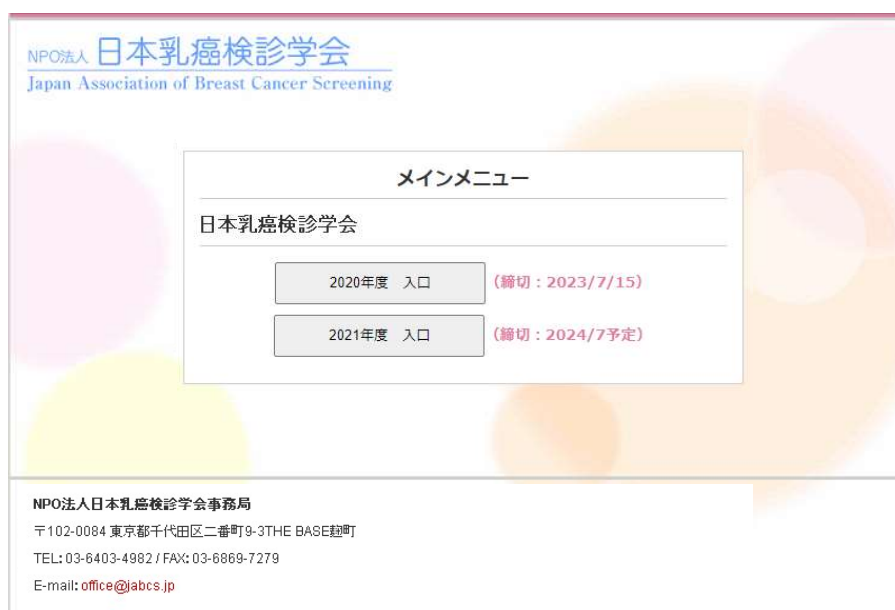
図 3.2 過年度入力なし(本年度新規登録)